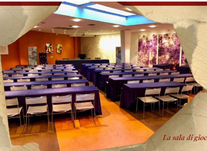
La sala di gioco

DATE: 30 Novembre - 08 Dicembre 2019 RIMBORSO SPESE : € 3.000 SEDE DI GIOCO: "Sala Forum Analysis" via Caradosso, 14 - 20123 Milano SISTEMA DI APPAIAMENTO: Svizzero/Olandese